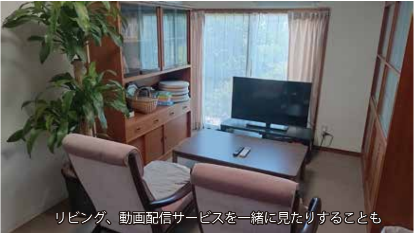
リビング、動画配信サービスを一緒に見たりすることも

的にも精神的にも自立を支援し、社会で生き抜く力を育みます。 ホーム毎に特色が 自立援助ホームは行政による画一的な運営という訳ではないため、ホームにより様々な支援の形やルールがあり、利用料金も違います。カーネーションでは、女子のみを受け入れ対象とし、現在の入居者は 3 名、高校や専門学校に通いながら生