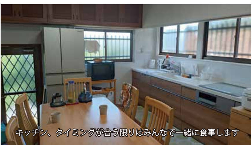
キッチン、タイミングが合う限りはみんなで一緒に食事をします