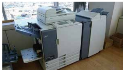
◀カラー印刷機 ポスタープリンタ▶

和歌山ビッグ愛9階にある和歌山県 NPO サポートセンターは、県民のみなさまの公益的な活動を総合的に応援する施設です。ご利用をお待ちしています！