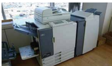
◀カラー印刷機 ポスタープリンタ▶

どちらも利用団体登録が必要です。 なお、公益性のある取り組みに 関する印刷に限らせていただいで あります。