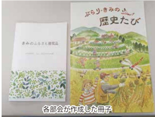
各部会が作成した冊子

この会議は、若者や学生がまちのことを度なしに話し合う場です。この場が行政との接点となり、紀美野町にとっての意義のある活動が生まれています。