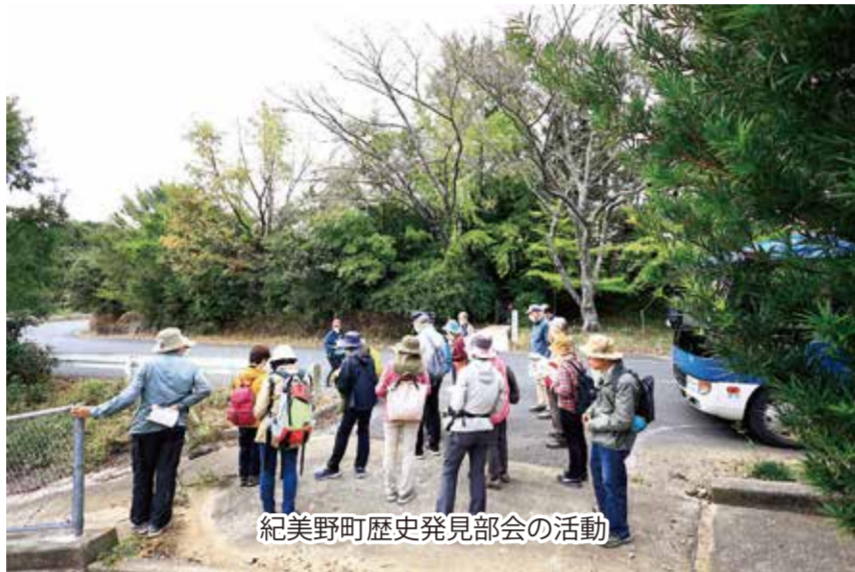
紀美野町歴史発見部会の活動

まちづくり推進協議会では、若者や学生がまちのことを度なしに話し合う場です。この場が行政との接点となり、紀美野町にとっての意義のある活動が生まれています。