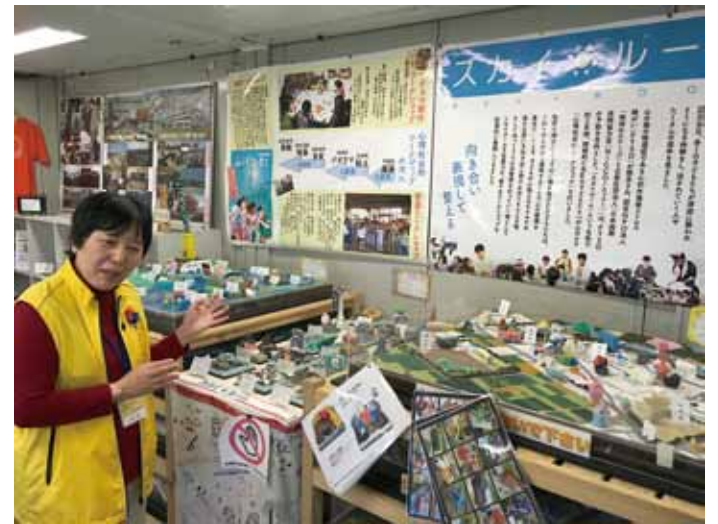
大きな被害を受けた名取市関上（ゆりあげ）で、現地の方に被災状況をうかがう活動も。

石巻市上釜会館で開催された「みかん運動会」。和歌山のみかんを使ったバケツリレーや、箱から箱にみかんを移す速さを競う「みかん移し」など、幅広い年齢層の住民のみなさんと楽しみました。