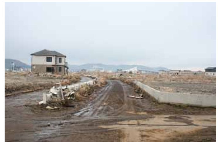
2011年12月当時の石巻市の様子。今は相当復興が進んでいますが、震災から9ヶ月半経ってもこの状態でした。

被災地・石巻市で有田みかんを使った運動会を続けたい! この活動は民間助成金などを原資としていましたが、今年からはクラウドファンディングをもちに、和歌山市の片男波海水浴場に、どこまで津波が到達するかイメージできるキリンの形の看板を設置しました。このように、被災地の経験が和歌山でも少しずつ活かされています。