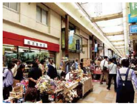
ポポロハスマーケットの様子 (Facebook ページより)

「魅力的なサービスな空間設計等によりデザインされた時間」を顧客が消費することを「コト消費」と位置づけ、需要と供給を同じ時間・場所で発生させるために複数のサービスが近辺の集積することが大事だとし、地域を一体的・面的にマネジメントすることが重要であるとしている。