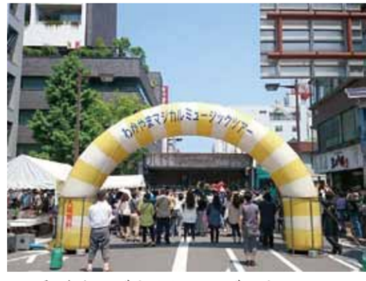
和歌山マジカルミュージックツアー

て久しい状況にあります。しかし、各地で様々な取り組みが進められており、商店街のような商業の集積地域が「モノ消費」から「コト消費」の場へと変貌を遂げつつある事例もみられるようになってきました。